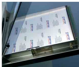
Zuführstation für bis zu 40 Bögen