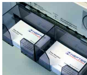
Saubere Ablage der Kartenstapel