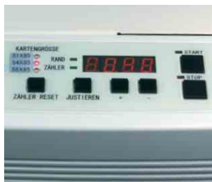
Übersichtliches Bedientableau mit Kartenzähler

Die CC 334 ist ideal für den Einsatz z.B. in Hausdruckereien, Copy Shops, Marketingabteilungen oder bei Druckdienstleistern.