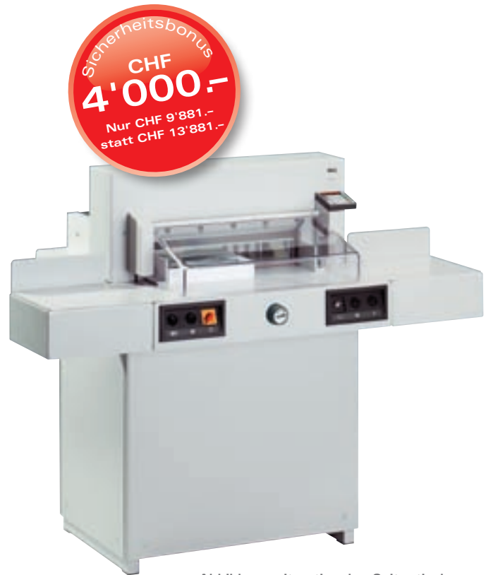
Abbildung mit optionalen Seitentischen.