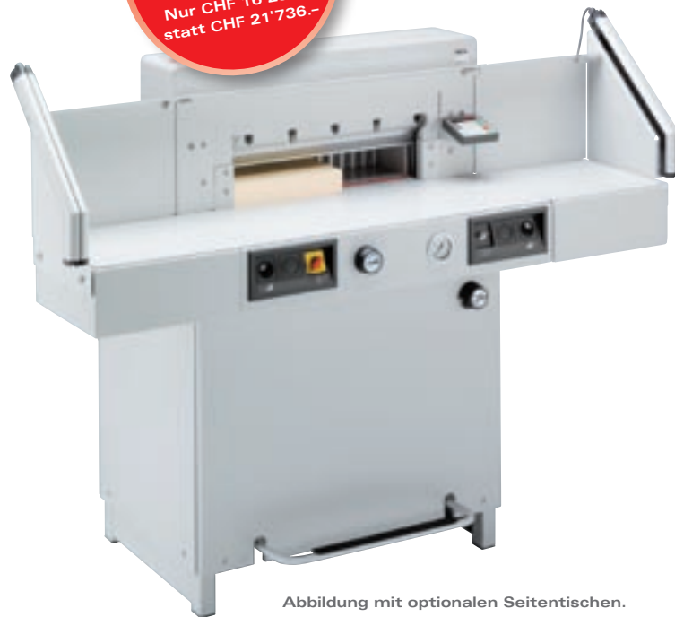
Abbildung mit optionalen Seitentischen.

Sicherheitsbonus CHF 5'500.- Nur CHF 16'236.- statt CHF 21'736.-