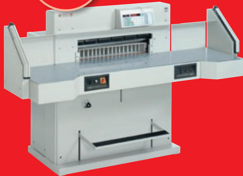
Abbildung mit optionalen Seitentischen.

Sicherheitsbonus CHF 5'500.- Nur CHF 26'458.- statt CHF 31'958.-