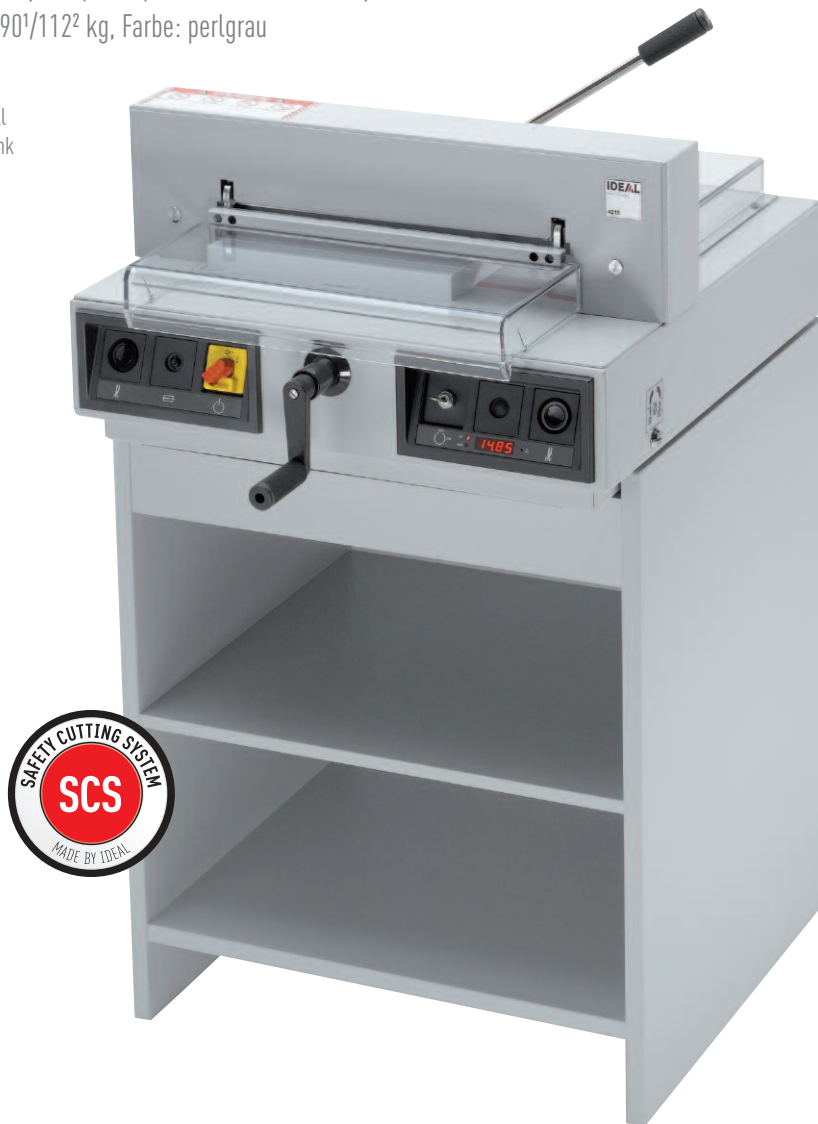
IDEAL 4215 mit optionalem Unterschrank